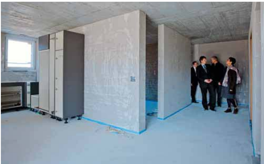
Bald werden hier die ersten Seniorinnen und Senioren in diese Wohnung einziehen.

■ Seniorenresidenz: Solche Residenzen werden in der Regel nicht mit Krankheit und Behinderung assoziiert und haben eine recht hohe Akzeptanz. Wie in anderen Alterswohneinrichtungen haben die Bewohnerinnen und Bewohner eigene altersgerecht eingerichtete Wohnungen. Zusätzlich sind aber noch verschiedene Serviceleistungen im Mietpreis inbegriffen wie Mahlzeiten, die im eigenen Heim oder im angeschlossenen Restaurant eingenommen werden können, Zimmer-/Wohnungsreinigungen, Waschen und Bügeln etc. Oft werden in diesen Seniorenresidenzen auch zahlreiche Aktivitäten angeboten.